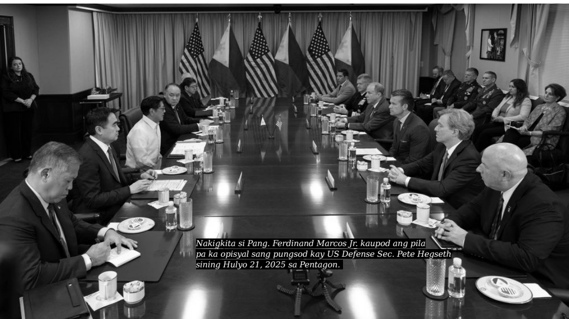
Nakiqkita si Pang. Ferdinand Marcos Jr. kaupod ang pila pa ka opisyal sang pungsod kay US Defense Sec. Pete Hegseth sining Hulyo 21, 2025 sa Pentagon.

"Yara sa hyperdrive" man kon malaragway ang pagkarakasa ni Marcos kag sang Armed Forces of the Philippines (AFP) nga tumanon ang mga dikta sang US kag tungdan ang gintalana nga papel sang ido-ido nga gobyerno sini santo sa nasambit nga estratehikong plano. Kabaylo sa si-ning pagpa-ido-ido ang ginahatag nga suporta pangpulitika kag pang-militar sang US kay Marcos. Sa mga tuig 2022 kag 2024, nagbaton si Marcos sang $1.14 bilyon (₱64.98 bilyon) sa idalum sang programa nga Foreign Military Financing sang US, wala labot pa sa iban nga ayuda