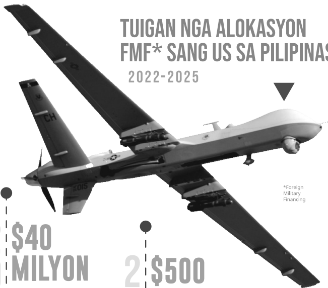
*Foreign Military Financing

Masobra doble sa istandard nga alokasyon $40; natalana para sa modernisasyon sang AFP (posible pangbakal sang mga Boeing CH-47 Chinook helicopters kag armored vehicles )