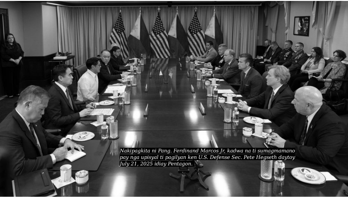
Nakipagkita ni Pang. Ferdinand Marcos Jr, kadwa na ti sumagmamano pay nga opisyal ti pagilyan ken U.S. Defense Sec. Pete Hegseth daytoy July 21, 2025 idiay Pentagon.

Mailadawan met nga "adda iti hyperdrive " ti panagpakpakaaso-aso ni Marcos ken ti Armed Forces of the Philippines (AFP) a tungpalen dagiti diktar ti US ken akemen ti intuding daytoy a papel ti aso-aso a gubyrno na segun iti nadakamat nga estratehiko a plano. Kasukat daytoy a panagpakpakaaso-aso ti it-ited a suporta iti pulitika ken militar ti US ken Marcos. Iti baet ti 2022 ken 2024, immawat ni Marcos ti $1.14 bilyon (₱64.98 bilyon) iti uneg ti programa a Foreign Military Financing ti US,