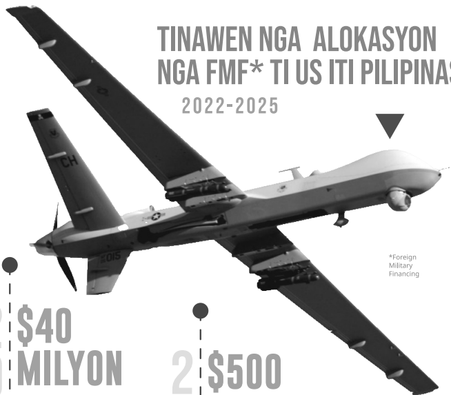
*Foreign Military Financing

Nasurok doble iti istandard nga alokasyon a $40; nakalatang para iti modernisasyon ti AFP (posible a paggatang kadagiti Boeing CH-47 Chinook helicopters ken armored vehicles )