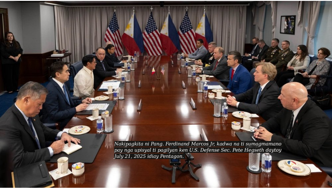
Nakipagkita ni Pang. Ferdinand Marcos Jr, kadwa na ti sumagmamano pay nga opisyal ti pagilyan ken U.S. Defense Sec. Pete Hegseth daytoy July 21, 2025 idiaay Pentagon.

Mailadawan met nga "adda iti hyperdrive " ti panagpakpakaaso-aso ni Marcos ken ti Armed Forces of the Philippines (AFP) a tungpalen dagiti diktar ti US ken akemen ti intuding daytoy a papel ti aso-aso a gubyrno na segun iti nadakamat nga estratehiko a plano. Kasukat daytoy a panagpakpakaaso-aso ti it-ited a suporta iti pulitika ken militar ti US ken Marcos. Iti baet ti 2022 ken 2024, immawat ni Marcos ti $1.14 bilyon (₱64.98 bilyon) iti uneg ti programa a Foreign Military Financing ti US,