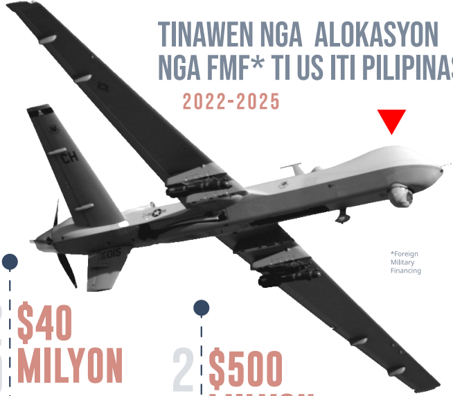
*Foreign Military Financing

Nasurok doble iti istandard nga alokasyon a $40; nakalatang para iti modernisasyon ti AFP (posible a paggatang kadagiti Boeing CH-47 Chinook helicopters ken armored vehicles)