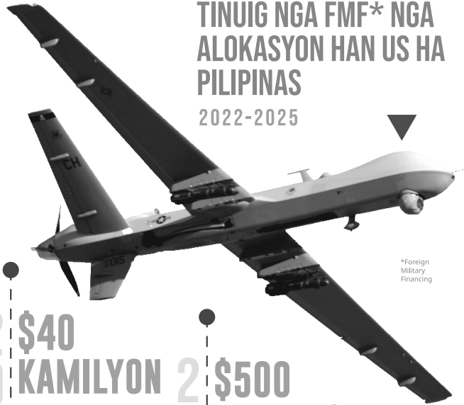
*Foreign Military Financing

Masobra doble ha istandard nga alokasyon nga $40; nakaalutaga para ha modernisasyon han AFP (posible nga pagpalit han mga Boeing CH-47 Chinook helicopters ngan armored vehicles )