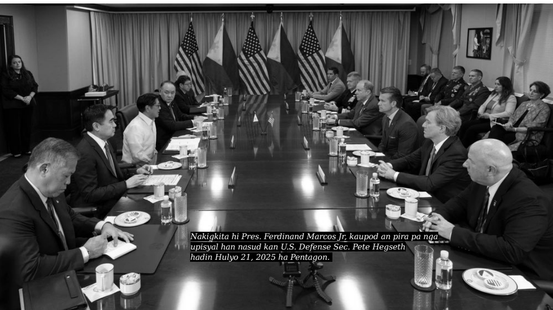
Nakiqkita hi Pres. Ferdinand Marcos Jr, kaupod an pira pa nga upisyal han nasud kan U.S. Defense Sec. Pete Hegseth hadin Hulyo 21, 2025 ha Pentagon.

"Aada ha hyperdrive" liwat nga mahilaladawan an kalisang ni Marcos ngan han Armed Forces of the Philippines (AFP) nga tumanon an mga dikta han US ngan igpatuman an igintalaan nga papel han niyutiyo nga gubyrno hini subay ha nasering nga estratehiko nga plano. Kabalyo hini nga pagpakaniyutiyo an iginhahatag nga pampulitika ngan panmilitar nga suporta han US kan Marcos. Giutan han 2022 ngan 2024, nagkarawat hi Marcos hin $1.14 kabilyon (₱64.98 kabilyon) ilarum han programa nga Foreign Military Financing han US, labot pa ha $332.3