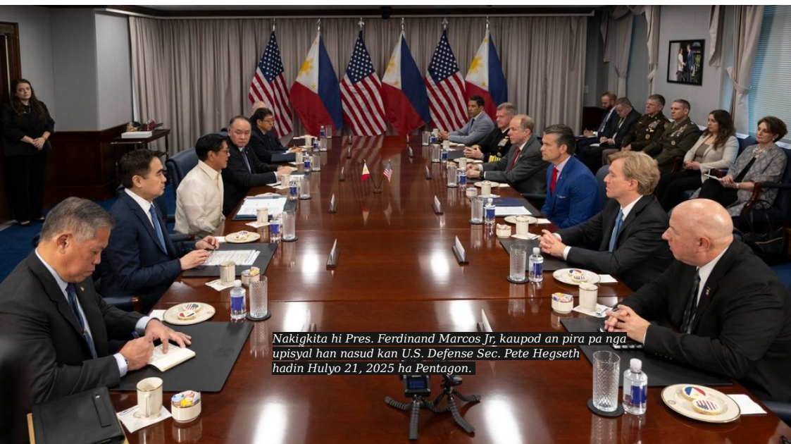
Nakiqkita hi Pres. Ferdinand Marcos Jr, kaupod an pira pa nga upisyal han nasud kan U.S. Defense Sec. Pete Hegseth hadin Hulyo 21, 2025 ha Pentagon.

"Aada ha hyperdrive" liwat nga mahilaladawan an kalisang ni Marcos ngan han Armed Forces of the Philippines (AFP) nga tumanon an mga dikta han US ngan igpatuman an igintalaan nga papel han niyutiyo nga gubyrno hini subay ha nasering nga estratehiko nga plano. Kabalyo hini nga pagpakaniyutiyo an iginhahatag nga pampulitika ngan panmilitar nga suporta han US kan Marcos. Giutan han 2022 ngan 2024, nagkarawat hi Marcos hin $1.14 kabilyon (₱64.98 kabilyon) ilarum han programa nga Foreign Military Financing han US, labot pa ha $332.3