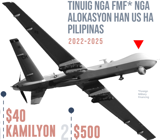
*Foreign Military Financing

Masobra doble ha istandar nga alokasyon nga $40; nakaalutaga para ha modernisasyon han AFP (posible nga pagpalit han mga Boeing CH-47 Chinook helicopters ngan armored vehicles )