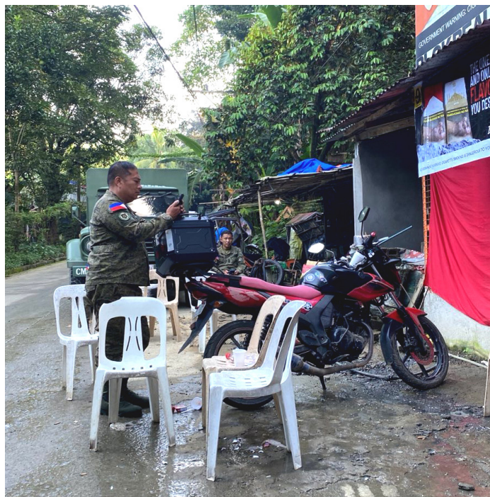
Mga elemento ng 80th IBPA sa burol ni Ka SY

Matagal na bininbin, pinabayaang at itinago ng militar ang labi ni Ka SY kaya umaalingasaw na ang amoy at lumobo na rin ang katawan nito. Nang masilayan ng isang kaanak at paralegal