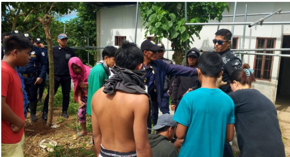
Pagkumpronta ng mga magsasaka sa security guards sa Tartaria

Naiulat pa ang terrorist-tagging sa mga organisasyon at lider magsasaka sa rehiyon. Nagkalat sa social media at sa iba’t ibang sakahan ang mga poster na nagpipinta sa mga organisador bilang terorista. ☒