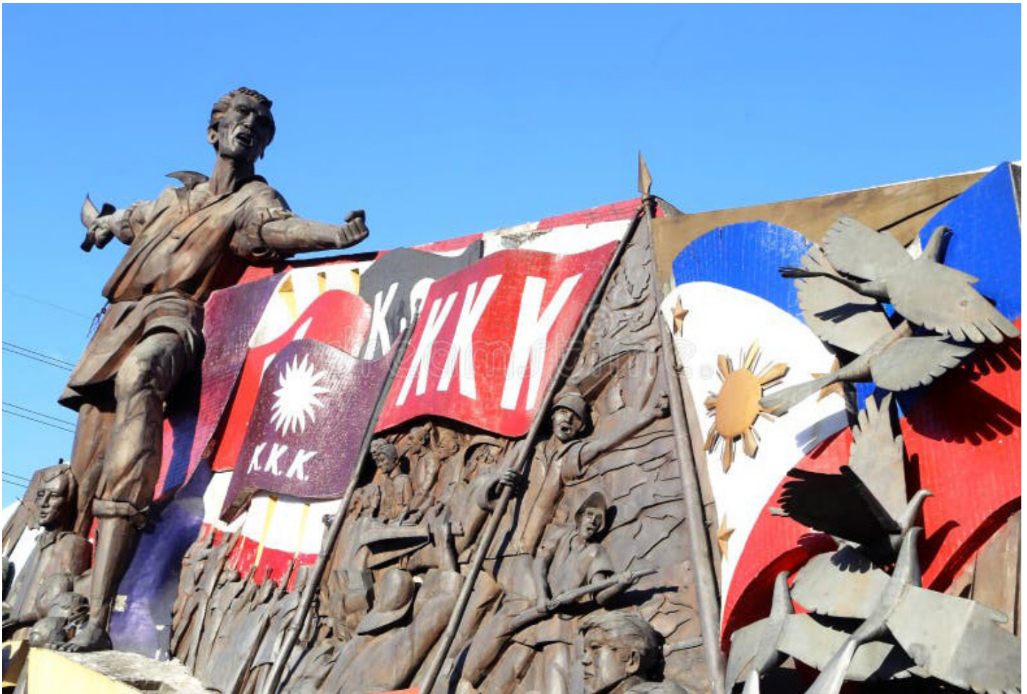
Andres Bonifacio Shrine Monument, Central Manila, Philippines

Hindi magagapi ang rebolusyong Pilipino dahil patuloy na ginagampanan ng uring inaapi at pinagsasamantalahan ang kanilang aktibong papel sa pagpapabagsak sa tatlong salot at ugat ng kahirapan na imperyalismo, pyudalismo at burukrata kapitalismo. Sa harap ng tumitinding tunggalian ng mga uri, ng mga kontradisyong panlipunan, at ibayong kahirapan at sakripisyo hanggang maging sa kamatayan, nananatiling matatag, pursigido, at walang humpay na isinusulong ng sambayanan ang demokratikong rebolusyong bayan upang hawanin ang landas sa pagtatatag ng sosyalistang lipunan. ☒