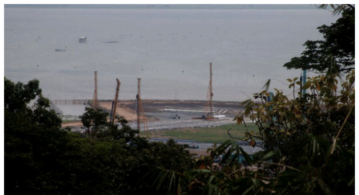
Mga istruktura ng hydrodam project na itinayo sa baybayin ng Laguna Lake. Tanaw mula sa Bundok Ping-as.

panggigipit at sapilitang pagpapalayas ng kumpanya sa ilang residente ng mga apektadong barangay. ☒